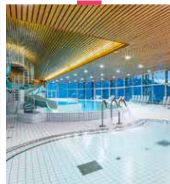
VILLAGE A THÈME BUSSANG MASSIF DES VOSGES