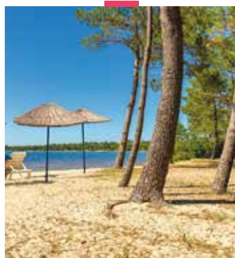
CLUB LACANAU MÉDOC-ATLANTIQUE

SÉJOURS INDIVIDUELS 04 84 311 311 prix d'un appel local contact@azureva-vacances.com