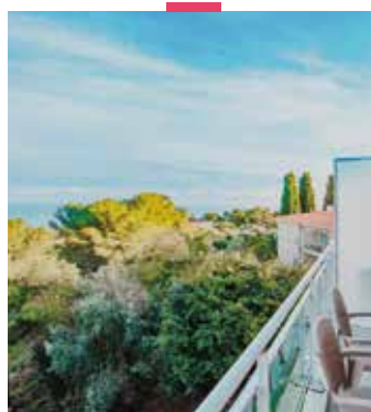
RÉSIDENCE "BELLA VISTA" ROQUEBRUNE-CAP-MARTIN CÔTE D'AZUR